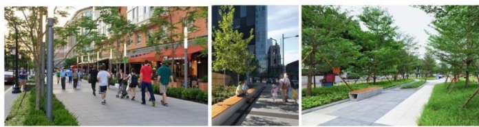
透過都更改善都市環境空間，創造優質開放空間增加人的互動與溫度

臺北市政府自去（105）年八月份起，即針對十餘件屬於企業集團或產權較為單純之都市更新劃定申請案件，研擬其公益性及必要性之審議原則，並要求各申請人就個案基地特性及需求，提出相關公益性回饋方案。再經過多方共同研商及努力後，首案結合公益回饋及都更願景之新光產險總部更新案，於106年6月30日經臺北市都市更新及爭議處理審議會第285次會議審議通過，為相關類似個案中通過之首案，也為企業結合公益推動更新事業之模式，定下了一個可供借鏡之參考。