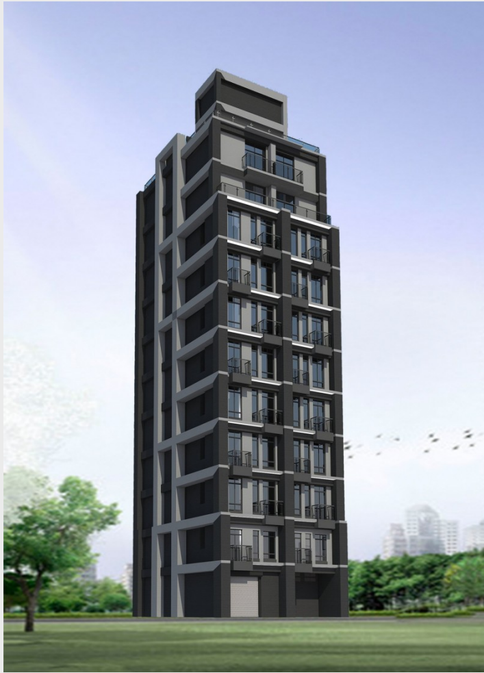
中和區安平段危老重建案今天動土，將改建為 11 層樓、約 41 戶的大樓。