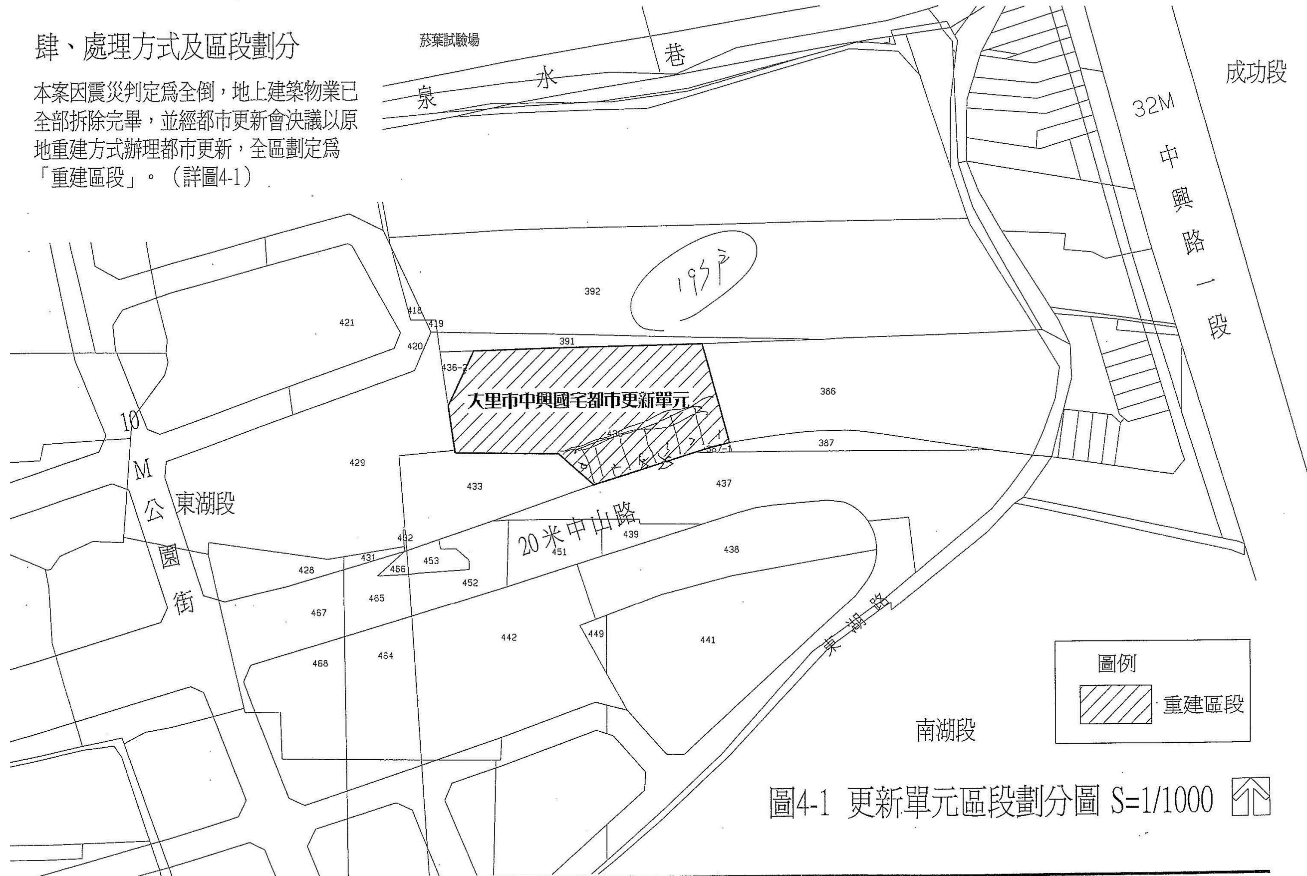
圖4-1 更新單元區段劃分圖 S=1/1000

本案因震災判定為全倒，地上建築物業已全部拆除完畢，並經都市更新會決議以原地重建方式辦理都市更新，全區劃定為「重建區段」。(詳圖4-1)