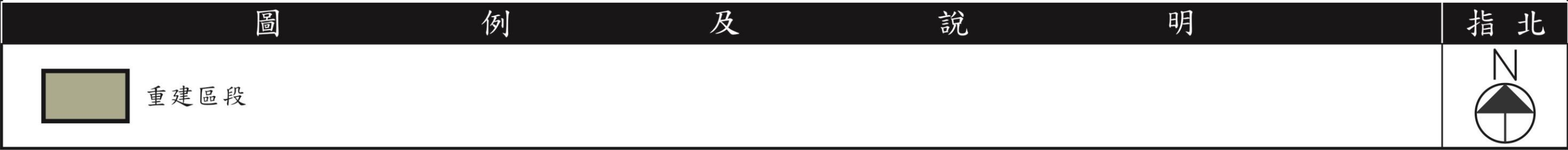
圖7-1-變、更新單元區段劃分圖 (S: 1/500)